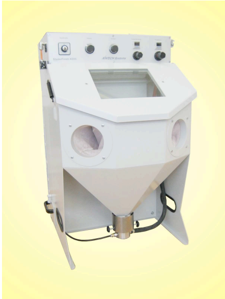
Installation de microsablage à injecteur MasterFinish XS 55

Les installations de sablage XS55 ont été développées pour le traitement de surfaces plus réduites. Les bases de la conception de la carcasse proviennent de 15 ans d'histoire couronnée de succès. Pour le reste on a introduit des caractéristiques techniques essentielles et de longues expériences de la série 75 dans le nouveau modèle type. En résumé, on a obtenu un produit à un faible coût, pourtant technologiquement très développé.