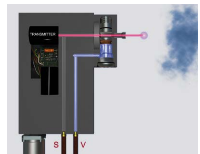
100% zuverlässig durch Blum-Schutzsystem

** Abhängig von Einbausituation, Stabilität der Befestigung, Abstand und Messart