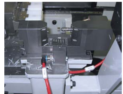
Auch als NT-H und NT-H 3D lieferbar