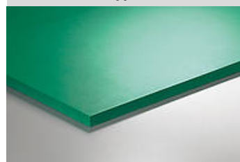
Illustration du type