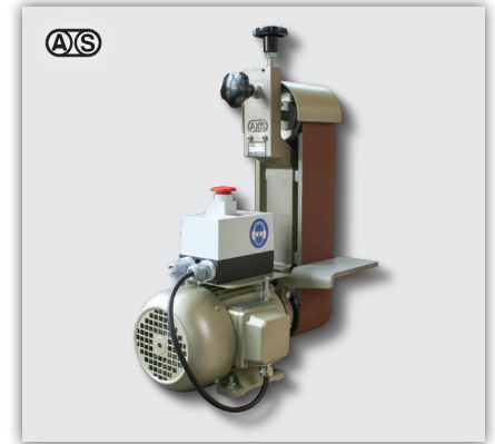
AS-10 Tischmodell, mit beidseitig freiem Arm AS-10 Modèle d'établi, au bras accessible des deux côtés

AS-5 avec ruban 50 mm x 600 mm AS-10 avec ruban 100 mm x 1000 mm AS-15 avec ruban 150 mm x 1500 mm AS-20 avec ruban 200 mm x 2000 mm