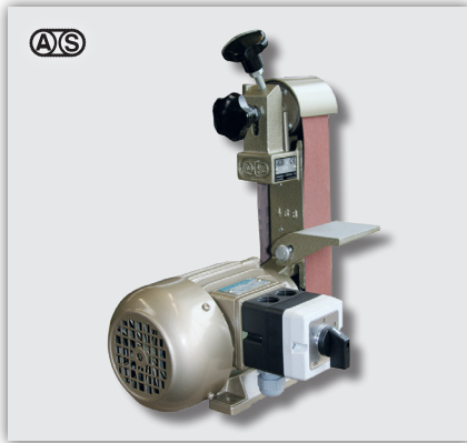
AS-5 Tischmodell, senkrecht gestellt AS-5 Modèle d'établi, en position verticale

Alle Modelle sind als Tischmodell wie auch als Sockelmodell erhältlich Tous les modèles sont disponibles comme modèle d'établi ou avec socle