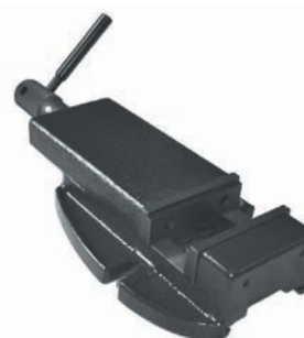
Etau EP 100 BF