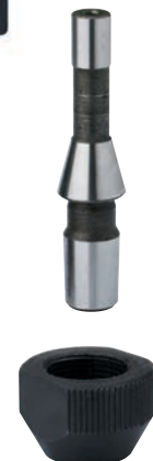
Arbre pour porte mandrin pour PE 5 pince