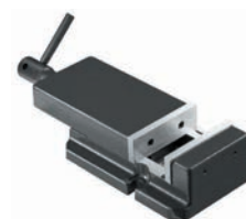
Etau EP 120 BF