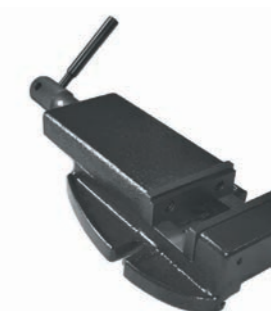
Etau EP 100 BF